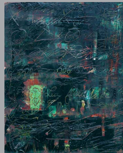
« La feuille de chêne », 31x40, huile sur bois, couteau, grattage