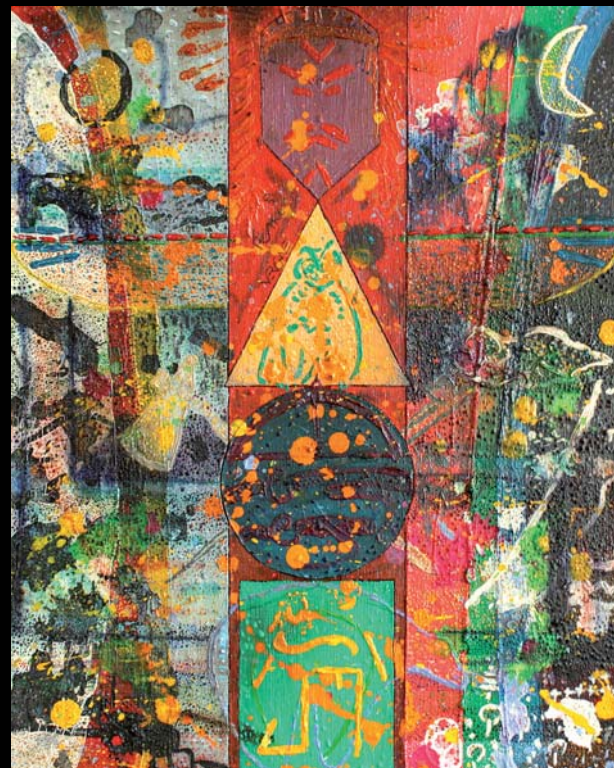
« Totem », 34x28, huile sur bois, acrylique, grattage, pinceau aiguille