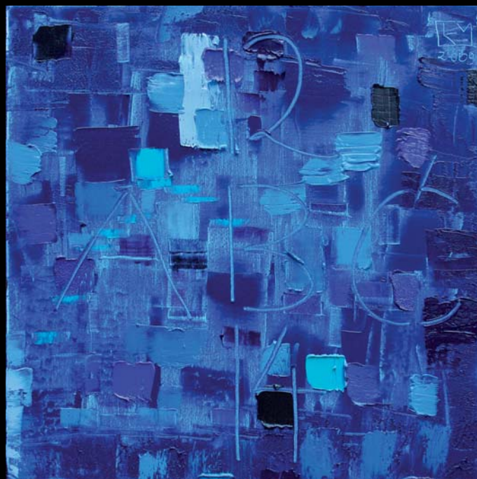
« ABC 12 13 14 », 50x50, huile sur toile, couteau, tube, grattage