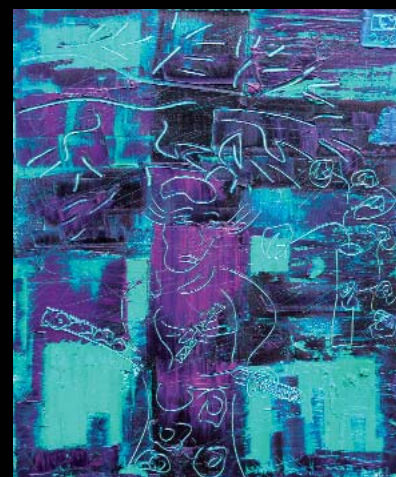
« Samourai et Ikébana », 44x38, huile sur toile, couteau

” La toile est un espace de jeu sans fin