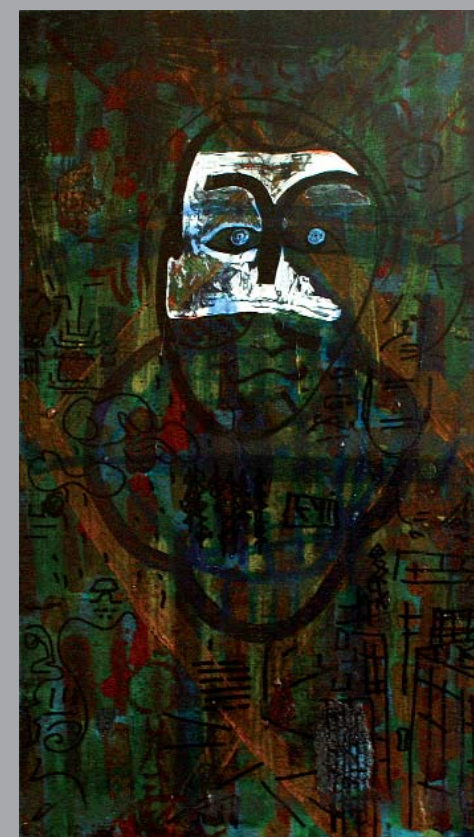
« Le hibou », 51x29, huile sur bois, acrylique, feutre, collages

Maison d'exposition, Place Saint-Nicolas, 47300 Pujols. Tél : 06 32 27 23 65 - Email : remivergne@gmail.com