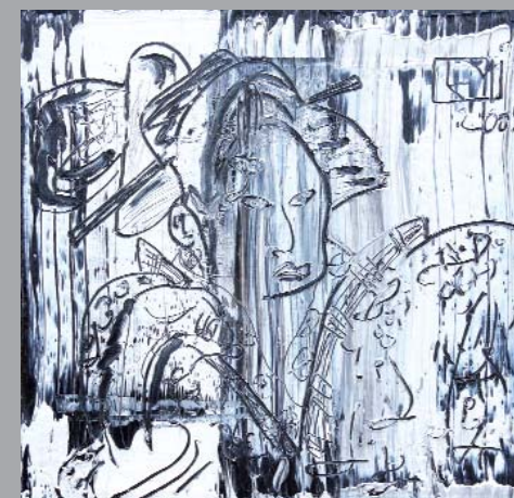
« La geisha », 50x50, huile sur toile, couteau, grattage